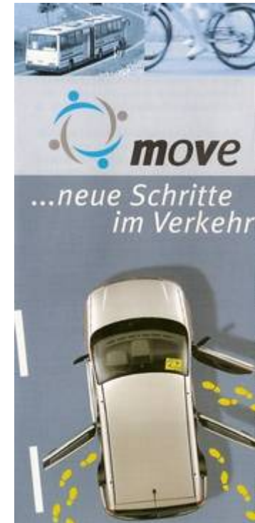
Grafik: Werner Hable